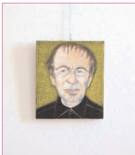
In questa pagina: l'artista Mila Dau e la sua serie "Visitors and Staff"; il ritratto di Vito Acconci (dalla serie "Face to Face"); tre opere dell'artista italo-canadese della serie "Enfilades" (in basso)

◆ L'architetto presenta gli oli su carta "Architectures"; i pastelli della serie "Enfilades", conclusi nel 2006; i "Visitors and Staff", il nuovo percorso artistico iniziato nel 2009. Presente anche una parte del ciclo pittorico terminato nel 2005 dal titolo "Face to Face"